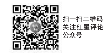
扫一扫二维码 关注红星评论 公众号

其实后人创作、挂名古人，在文学史上很常见。当代也不少，此前还有一首挂名李商隐的诗《送母回乡》被戳穿，其影响更大，还进入了不少出版物。客观来讲，这种现象是难以完全避免的。伪诗的出现原因比较复杂，可能是有意的造假，也可能是无意的讹传，也可能是编辑出版时的失误。所以，考订作品真伪，是文学研究一个几乎会永远存在的主题，甚至永远也不会有答案。《七步诗》是不是曹植所作，《忆秦娥》是不是李白所作，至今还有人在发文讨论。不过，《暮年》这种伪诗的出现，依然有某种“划时代”的意义。以往挂名的作品，至少要做到比较“像”，风格类似、面貌相近，才会有鱼目混珠的效果。但《暮年》却完全不像，简直是天差地别，但依然被拿来四处招摇撞骗。只能说，一些人对古诗还是有些隔膜，有些所谓国学号、营销号的把关能力实在堪忧。仔细捋顺《暮年》这首诗，会发现它虽然假，但因为“含糖度”很高，还是很让人舒服。诗句很好懂，没有生僻的典故；情感表达很直白，很对当代人吟风弄月的脾胃。这大概是这首诗传播广泛的原因，虽然很不“杜甫”，但确实很好读。我们今天的知识接收，应该小心这种“含糖度”高的知识。互联网语境下的知识传播，往往意味着低门槛、高渗透，知识不会遵循着严格的学术规范，在充分验证后呈现在我们面前。我们的知识获取，很有可能是在被迎合、被取悦的前提下完成的。作为一名文科生，这种伪诗当然骗不到我。但我也爱看一些关于科技、军事、宇宙、国际政治的所谓知识短视频，这些视频里，有没有类似《暮年》的这种乌龙？说实话，我恐怕没什么能力分辨出来。作为互联网的使用者，我们更应该形成某些防御性的心理预期：对那些让人感到舒适的知识，应该多一分小心。真的知识，永远是冲击人的认知边界的，会让人感到头痛、难懂、生涩、乏味。我们不必把轻易获取的短暂刺激，言之凿凿地当做一种知识。就像真正的杜甫诗，哪有好懂的。“画省香炉违伏枕，山楼粉堞隐悲笳”，“一卧沧江惊岁晚，几回青琐点朝班”，读一遍都让人费劲。但伟大的诗句、真正的知识，从来都是从沉思与磨砺中来，不会那么唾手可得。对待知识，我们应该抱有这种敬畏，把知识获取当作是对精神世界的拓展甚至颠覆，准备好承受一份脱胎换骨的“痛苦”。那些让人感官愉悦的“学习”，不妨就当作一种娱乐吧。成都商报-红星新闻特约评论员 易之