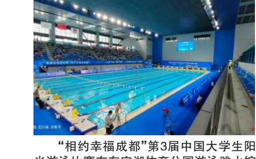
“相约幸福成都”第3届中国大学生阳光游泳比赛在东安湖体育公园游泳跳水馆开赛